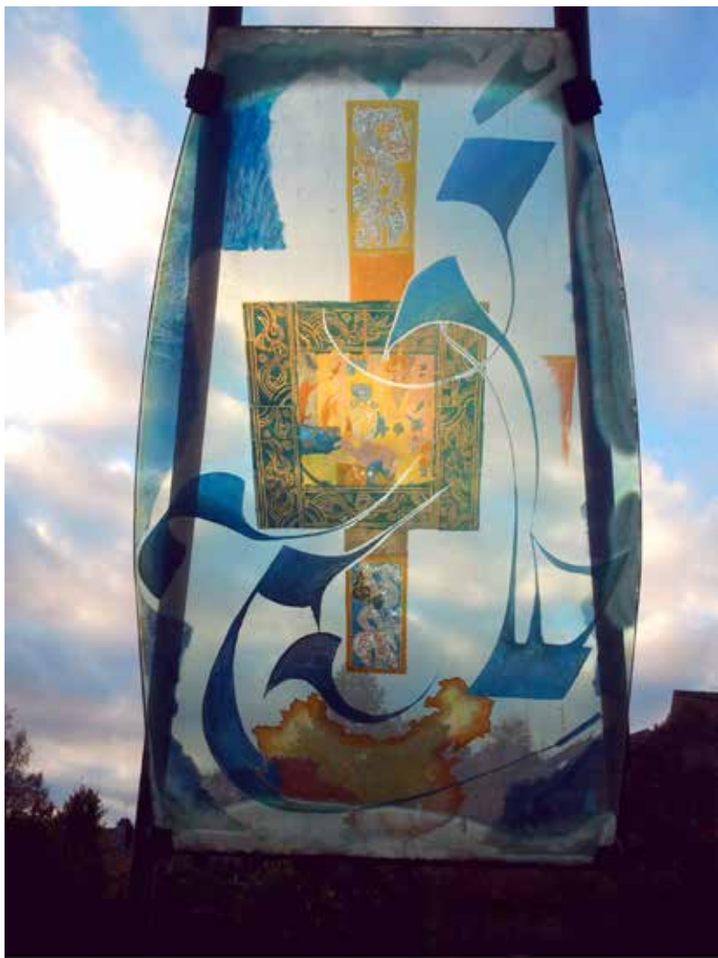
«Oeuvre à la vie» de Louis-Marie CATT Jardin du Nançon - Ville de Fougères (France 35)